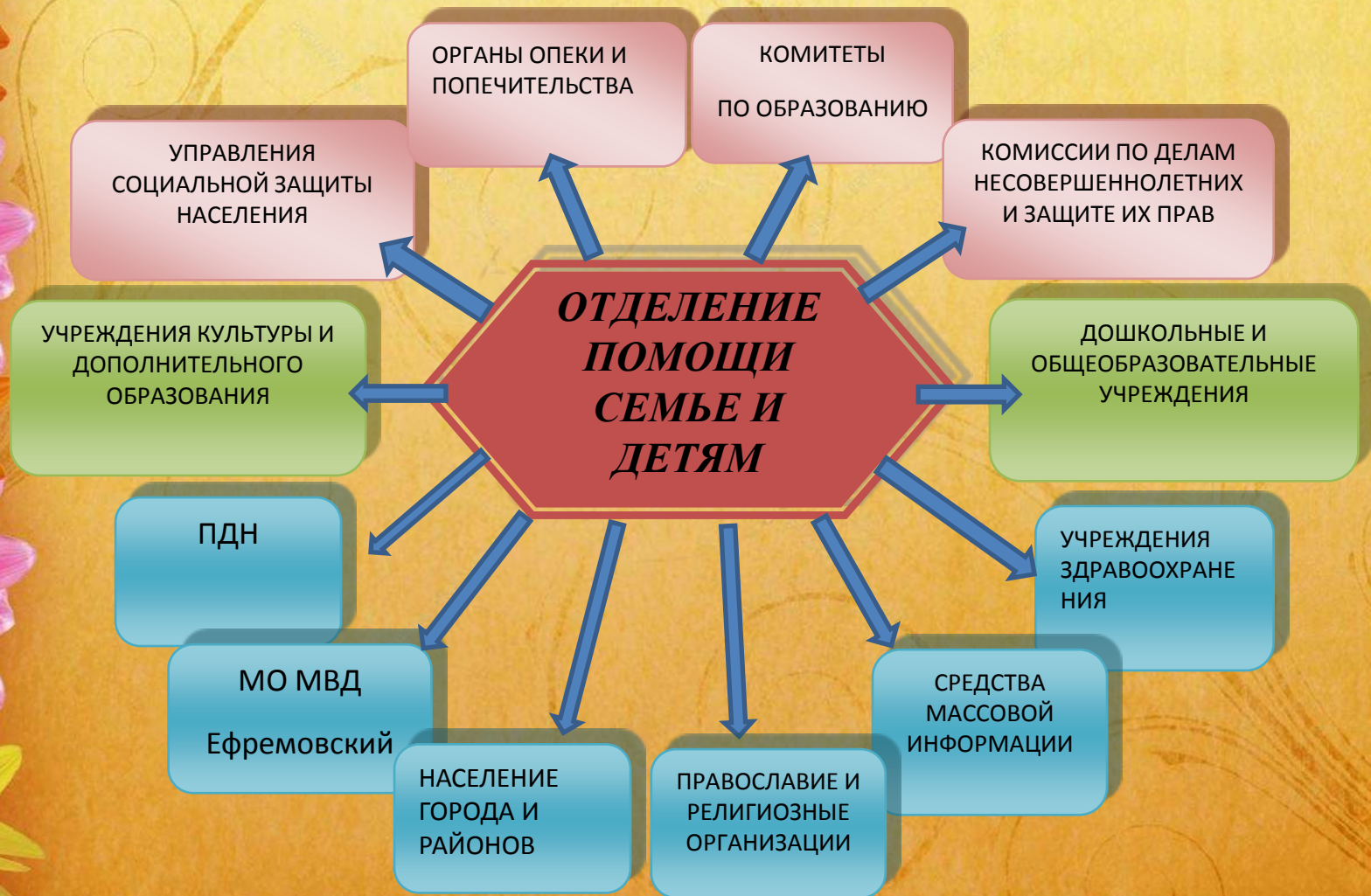
СХЕМА МЕЖВЕДОМСТВЕННОГО ВЗАИМОДЕЙСТВИЯ В РАМКАХ ВНЕДРЕНИЯ ПРАКТИКИ