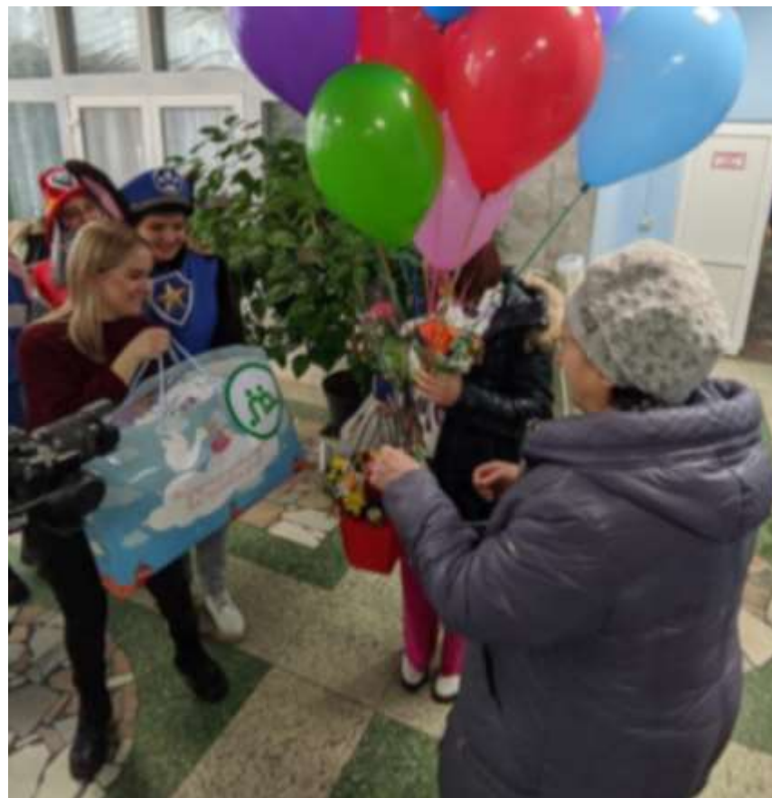
Встреча жены мобилизованного в роддоме