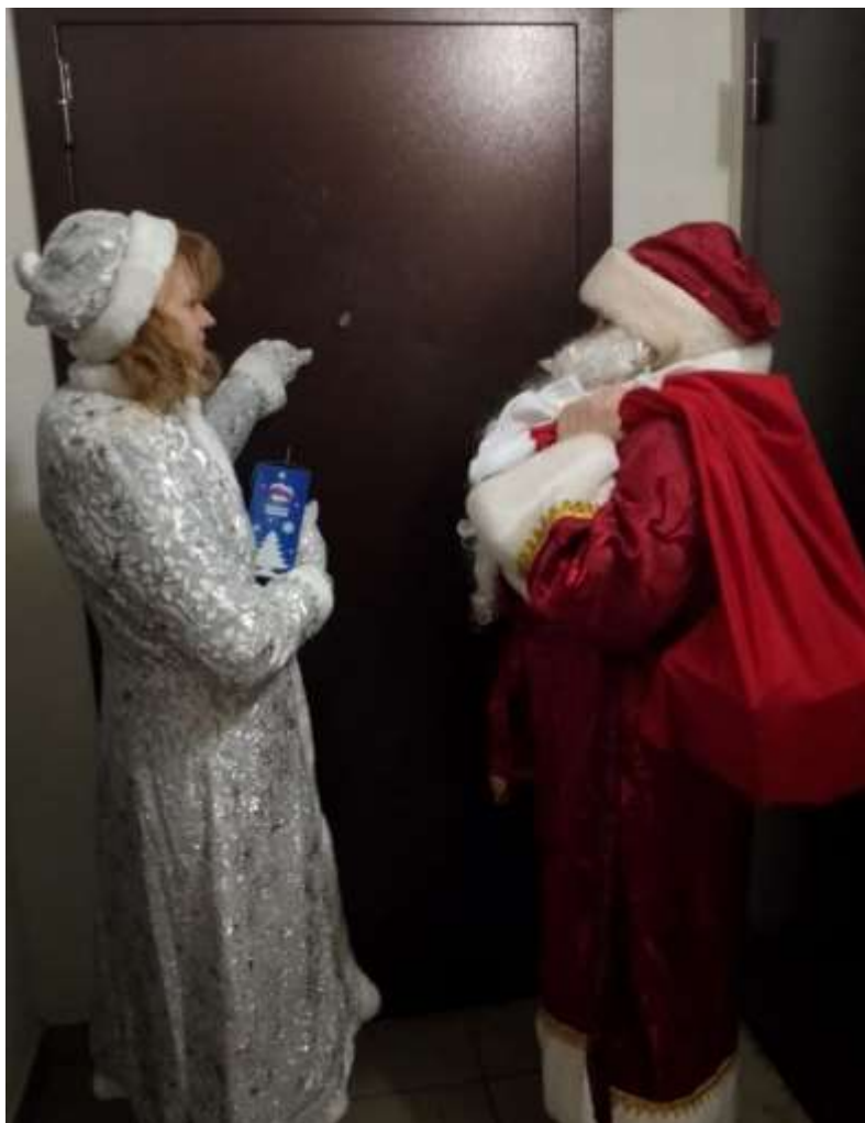
Поздравление Деда Мороза и Снегурочки